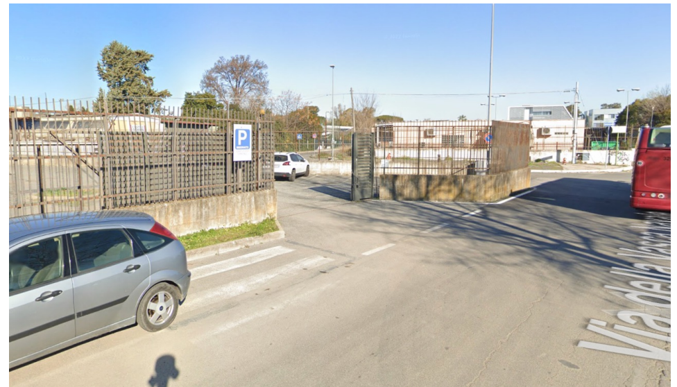
Parcheggio, lato opposto a Via della Vasca Navale 107